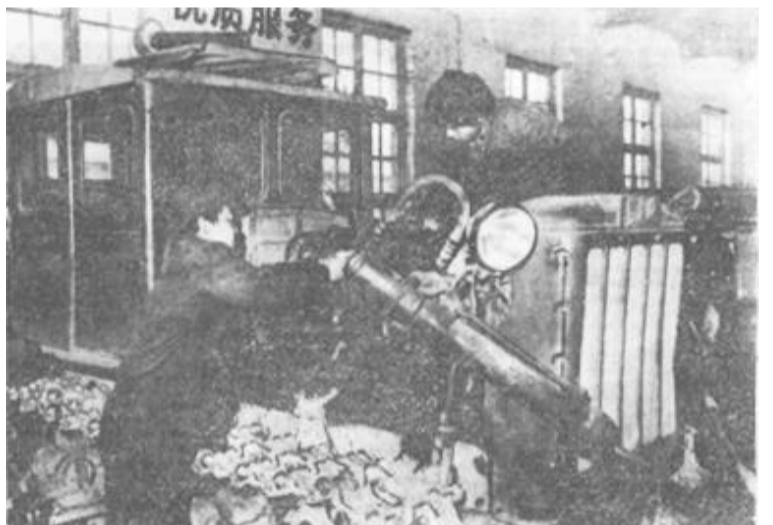
垦利县拖修厂积极开展多种定点维修，给企业带来后劲，经济效益在全省农机维修行业中名列前茅。图为工人们正在赶修农机具。